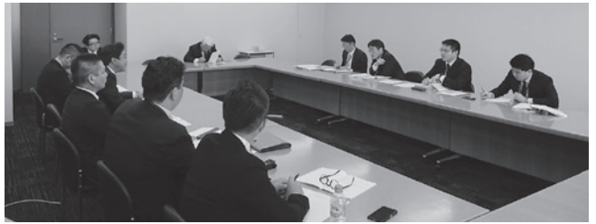
写真は2019年12月に行われた消防庁要請

4月30日、参議院総務委員会において、岸まきこ参議院議員が質疑にたち、新型コロナウイルス感染症の拡大を踏まえた自治体における対応の一つとして、消防現場での防疫等作業手当に関して質したのに対し、消防庁は、「新型コロナウイルス感染症により生じた事態に対処するための防疫等作業手当につきまして、その特例について総務省の公務員部から3月18日と4月21日の2度にわたり通知が出されている。消防庁としては、これらの通知に関しま