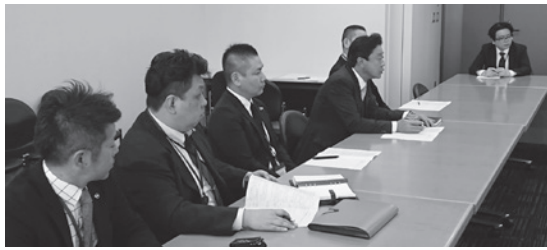
写真は2019年12月に行われた消防庁要請

この要望は、新型コロナウイルス感染症が全国的に拡大している中において、医療従事者などと同様に、最前線での対応にあたる消防行政の現状に基づき、幹事会で要望事項を取りまとめ、感染防止資器材の確保や職員の感染防止策さらには医療機関との連携等について具体的対応を求めるために行ったものです。