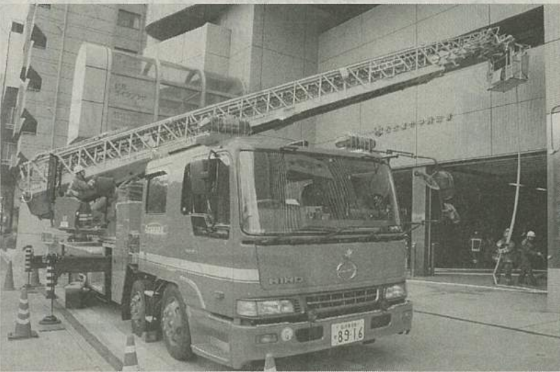
消防車両を使用し訓練する消防士ら一名古屋市